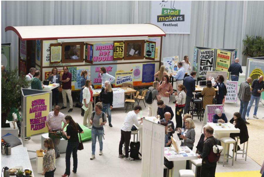
In mei 2022 was het eerste Stadmakersfestival

In dit startdocument schetsen we hoe de ambitie uit het coalitieakkoord de komende jaren wordt uitgewerkt binnen een nieuw programma Haags Stadmaken . In dat programma staat de samenwerking tussen initiatiefnemers of stadmakers en de gemeente Den Haag centraal. We gaan kort in op de volgende vragen: