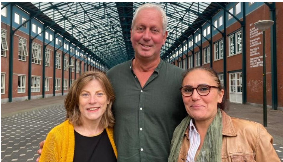
Team Stadmaken Laak