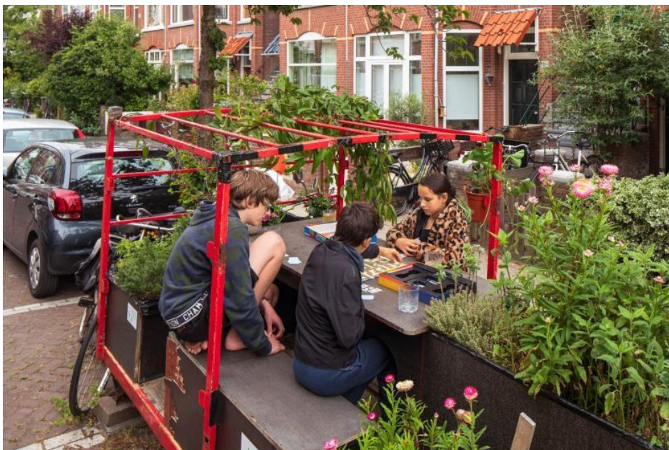
Stadmaken gaat uit van initiatieven van de bewoners zelf. Kleine én grotere initiatieven.

Een burger- of bewonersinitiatief is een idee van burgers om de leefomgeving te verbeteren i . Vooral binnen de stadsdelen is veel ervaring met dit soort wijkinitiatieven. Vaak gebeurt dit vanuit een sociale intentie. Zo zagen we in coronatijd een groei van het aantal sociale initiatieven in de buurt ii . Maar ook binnen de stadsdelen zijn ontzettend veel voorbeelden van sociale bewonersinitiatieven zichtbaar. Van het organiseren van buurtfestivals tot het onderhoud van de buitenruimte, de vele binnentuinen, activiteiten voor kinderen en ouderen, specifiek voor mensen in de problemen, natuur- en milieuactiviteiten en allerlei bijeenkomsten om de sociale samenhang in de buurt te vergroten.