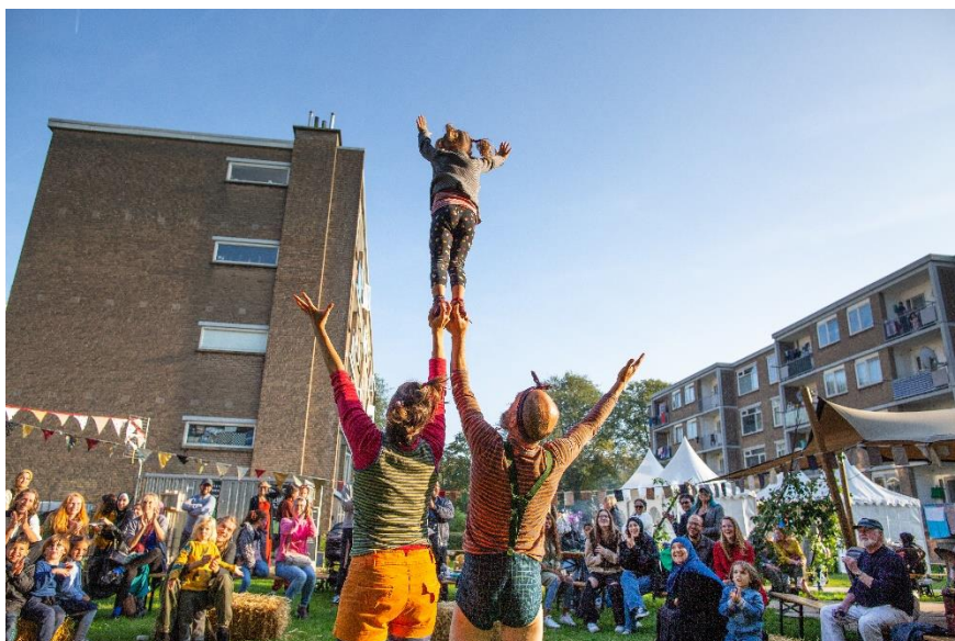
Door financieringsvormen inzichtelijk te maken, geven we stadmaken meer kansen

We maken voor initiatiefnemers overzichtelijk welke mogelijkheden er zijn voor financiële ondersteuning, en wat de voorwaarden daarvoor zijn. Zowel binnen als buiten de gemeente. Zowel met subsidies als (co-)financiering. Onderdeel hiervan is een inventarisatie van kansrijke regelingen in andere gemeenten.